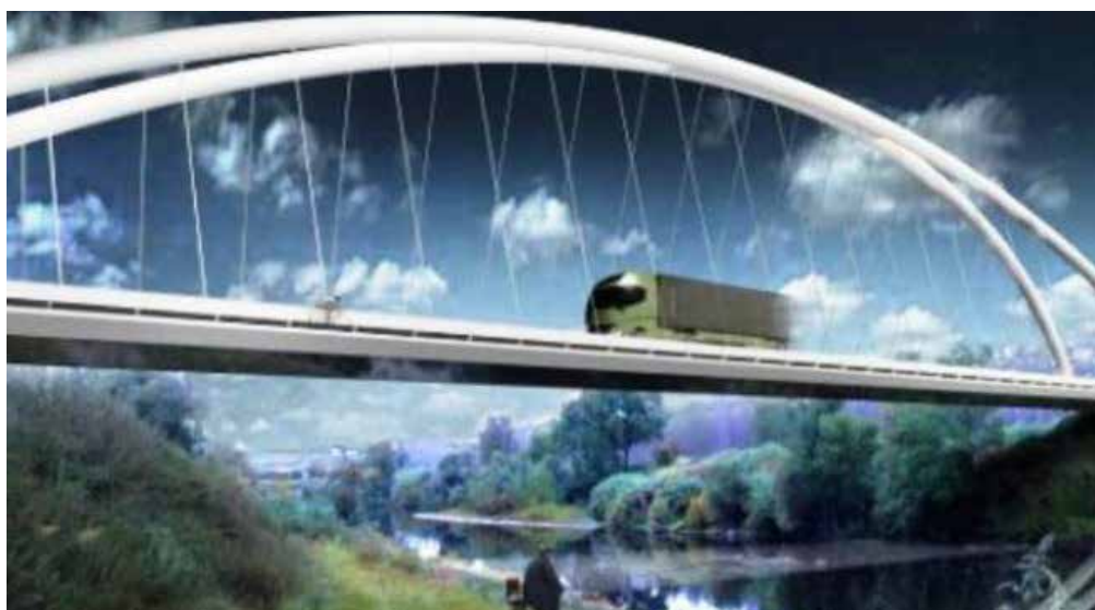
Ponte di collegamento Fibbiana e Limite _ Stanziamento comunale di 600.000 euro

in questo 2021 possa partire il cantiere per la realizzazione del ponte di collegamento fra Fibbiana e Limite , per cui Montelupo, così come tutti gli altri comuni interessati si è impegnato a contribuire con un investimento di 600.000 euro. Oltre 100.000 euro in bilancio sono destinati alla manutenzione delle strade e alla loro asfaltatura , in base ad un piano che tiene conto della situazione del manto e alla quantità di traffico supportato.