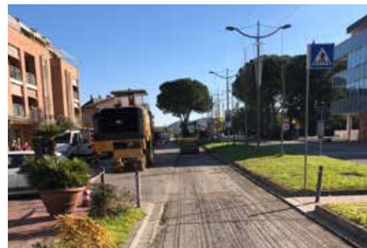
Asfaltature - Finanziamento di 100.000 euro