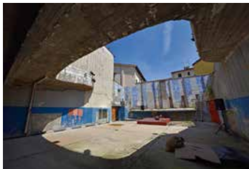
Recupero ex Risorti - Finanziamento di 415.000 euro