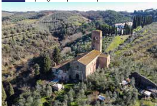
Riqualificazione del Castello - Finanziamento 300.000 euro