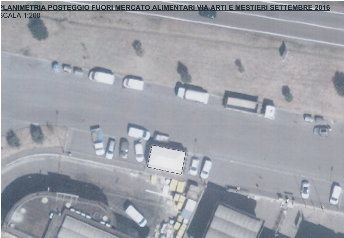
PLANIMETRIA POSTEGGIO FUORI MERCATO ALIMENTARI VIA ARTI E MESTIERI SETTEMBRE 2016 SCALA 1:200