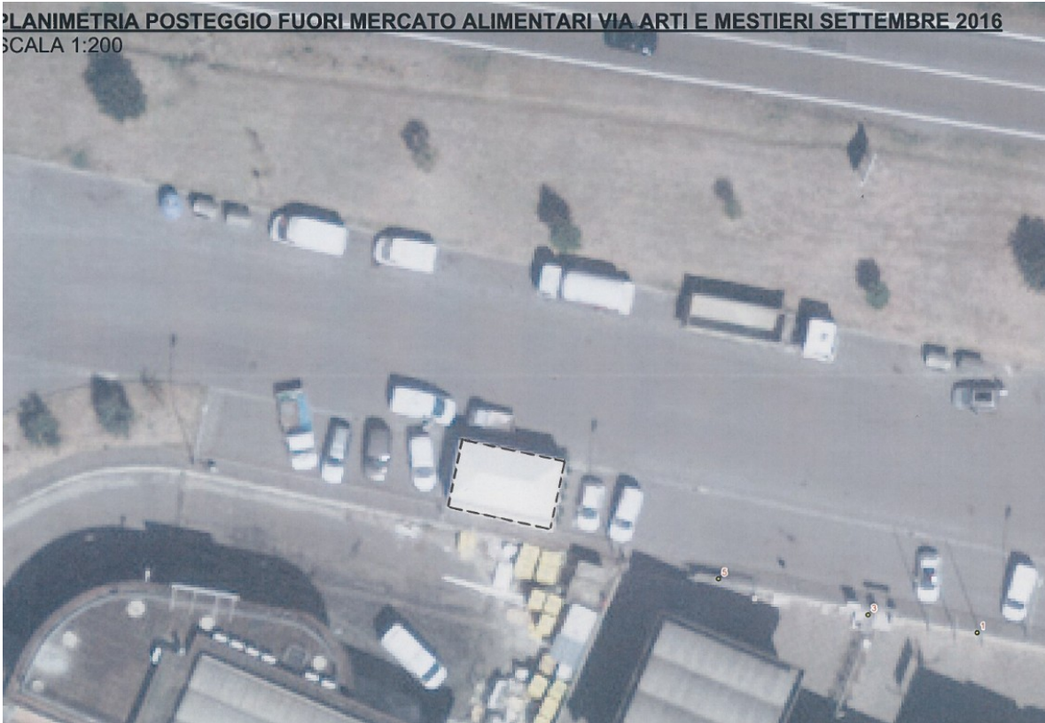
PLANIMETRIA POSTEGGIO FUORI MERCATO ALIMENTARI VIA ARTI E MESTIERI SETTEMBRE 2016 SCALA 1:200

Orario: Lunedì e giovedì dalle 10.00 alle 1.00 – venerdì dalle 10.00 alle 02.00