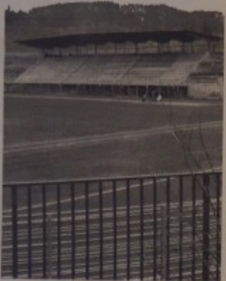
In alto a sinistra: la costruzione dell'edificio per 24 laboratori produttivi e la scuola della ceramica nella zona industriale. Qui sopra: lo sviluppo della nuova zona sportiva di via Marconi