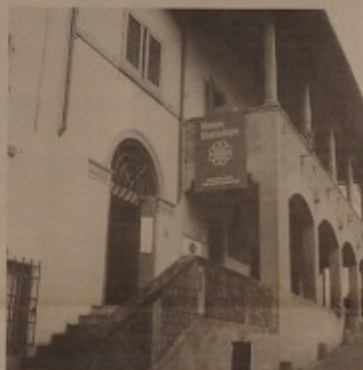
Alle pagine 4 e 5

Altre novità provengono dagli scavi effettuati dal gruppo archeologico di Montelupo, che ha trovato nuovi elementi di studio per la chiesa di S. Lucia all'Archeologia. Ed infine viene presentato a grande linee il progetto del museo della ceramica che entro il 2003 verrà realizzato da via Garibaldi alla scuola Corsolini in piazza Vittorio Veneto.