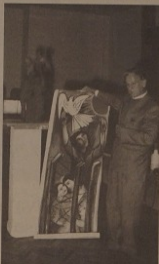
Riportiamo un primo prototipo provveduto al silenzio di nomi che hanno la sottoscrizione.

Il progetto per un nuovo Monumento ai caduti è stato presentato al pubblico e alla stampa nella sala del Consiglio Comunale. "Ho cercato di interpretare i contenuti di un messaggio semplice, ma efficace che vogliamo dare - sulla tragedia delle guerre e della deportazione prevalgono i valori positivi della famiglia, del lavoro e della pace". Il Monumento sorgerà in Piazza Vittorio Veneto dove oggi è eretto il cippo dedicato ai caduti la parte in bronzo alta oltre 2 metri e visibile a tutto tondo, sorreggerà una stele su cui poggieranno quattro grandi pannelli in maiolica, realizzati da Eugenio Tacchini. L'Associazione Combattenti e reduci di Montelupo ha aperto la sottoscrizione per finanziare l'opera: già numerosi cittadini, enti e associazioni hanno versato contributi sul conto corrente aperto in 4156 della Banca Popolare dell'Etruria e del Lazio) che al 24 novembre segnava un attivo di Lire 6.700.000.